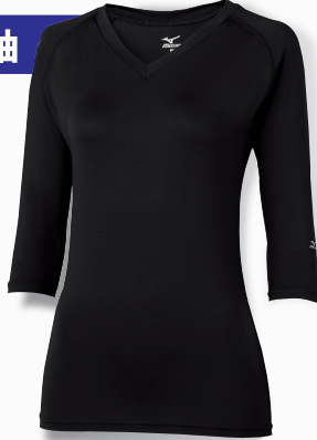
▲MZ-0134 C-10 ブラック