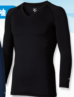
▲MZ-0155 C-10 ブラック