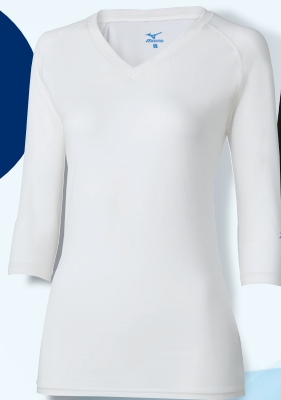
[女性用]MZ-0134 C-1 ホワイト