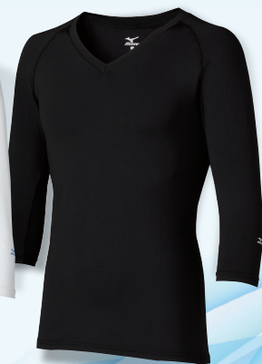
[男性用]MZ-0135 C-10 ブラック