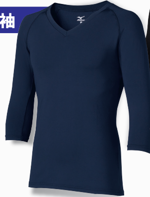
▲MZ-0135 C-5 ネイビー