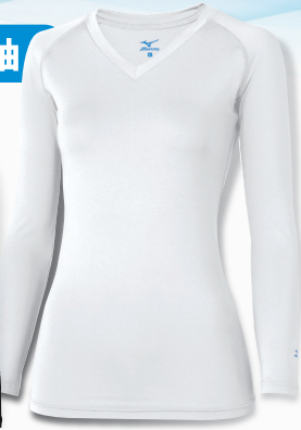
▲MZ-0154 C-1 ホワイト