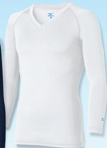
[男性用]MZ-0155 C-1 ホワイト